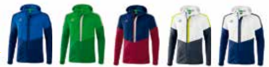
navy-royal He: 1032051 Da: 1032062 grün-grün He: 1032052 Da: 1032063 navy-bordeaux He: 1032053 Da: 1032064 grau-weiß He: 1032054 Da: 1032065 weiß-navy He: 1032055 Da: 1032066