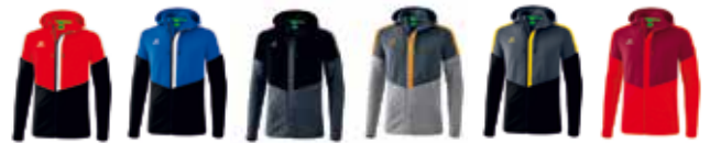
rot-schwarz He: 1032045 Da: 1032056 royal-schwarz He: 1032046 Da: 1032057 schwarz-grau He: 1032047 Da: 1032058 hellgrau - grau He: 1032048 Da: 1032059 schwarz-gelb He: 1032049 Da: 1032060 bordeaux-rot He: 1032050 Da: 1032061