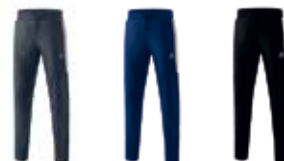
grau He: 1102002 Da: 1102006 navy He: 1102003 Da: 1102007 schwarz He: 1102001 Da: 1102005