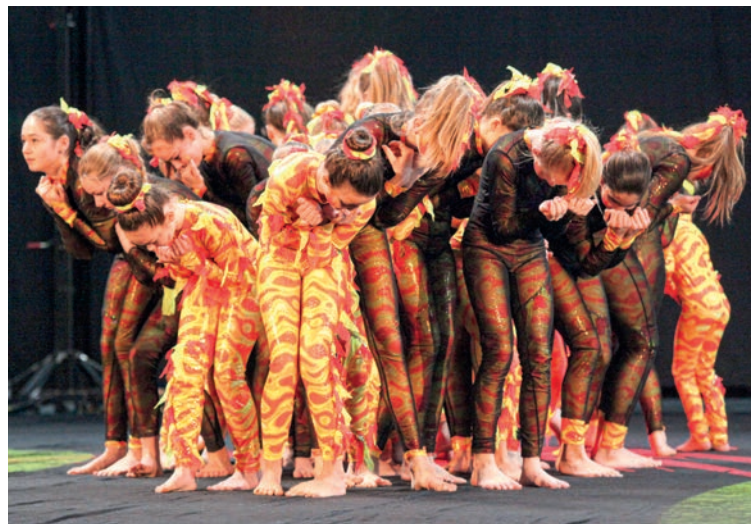
Rheinische Turnshow 2019; Foto: Richard Dohmen

Bei der Kinderturn-Show stehen unsere ganz kleinen Akteure im Alter von 3 bis 12 Jahren im Mittelpunkt und führen dem Publikum vor, was sie in den vergangenen Wochen fleißig geübt haben. Neben leuchtenden Kinderaugen und aufgeregten Eltern und Großeltern wird dem Publikum vor allem eines präsentiert: eine bezaubernde Show mit einer phantasiereichen Geschichte zum Mitmachen und Spaß haben!