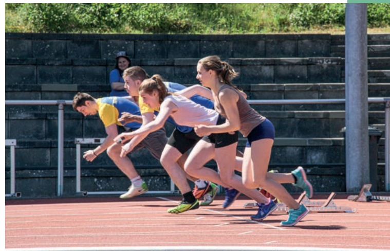
Wahlwettkampf NRW-Turnfest 2015

Im Bereich Gerätturnen wird das neue Turnprogramm „Turn10®“ an Boden, Parallelbarren, Schwebebalken und Minitramp angeboten. Alternativ kann auch zwischen den P-Stufen (Boden, Parallelbarren und Schwebebalken) ausgewählt werden. Außerdem können folgende Disziplinen gewählt werden: Rope Skipping (30 Speed, Easy Jump), Leichtathletik (50m-Lauf und Schleuderball), Schwimmen (50m Kraul, 50m Brust, 50m Rücken).