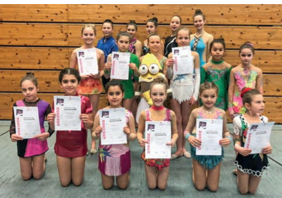
Gymnastinnen TV Kupferdreh.