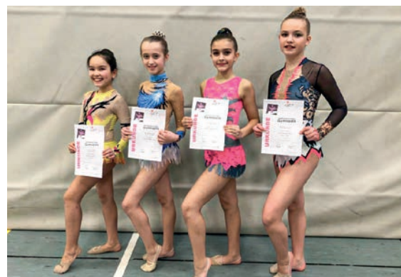
Gymnastinnen Essener TB SW.

In der nächsten Altersklasse K6 (8-10 Jahre) turnten die Gymnastinnen neben einer Übung ohne Handgerät auch eine Übung mit Seil. Die Meisten zeigten be-